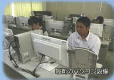
最新のパソコン設備