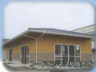
フードビジネス科販売所