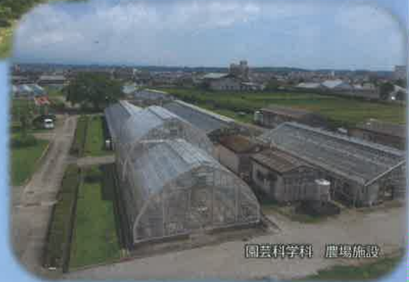
園芸科学科 農場施設