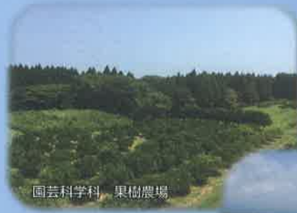
園芸科学科 果樹農場