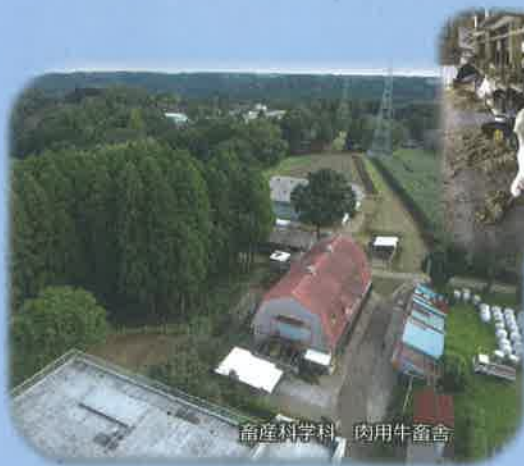
畜産科学科 肉用牛畜舎

食品加工施設は、県内で最新の設備を整え、将来食品関連産業への就職を有利にします。