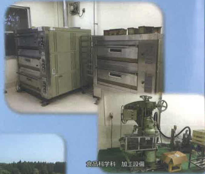
食品科学科 加工設備