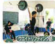
ウエイトリフティング部