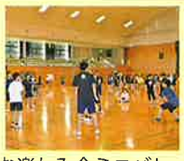
お楽しみ会ミニバレー