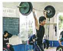
ウエイトリフティング部