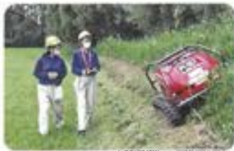
ラジコン草刈機による除草