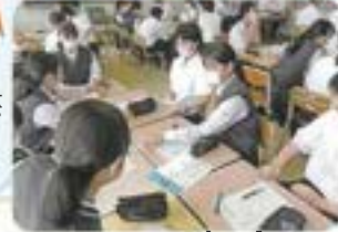
ライフスキルIの授業